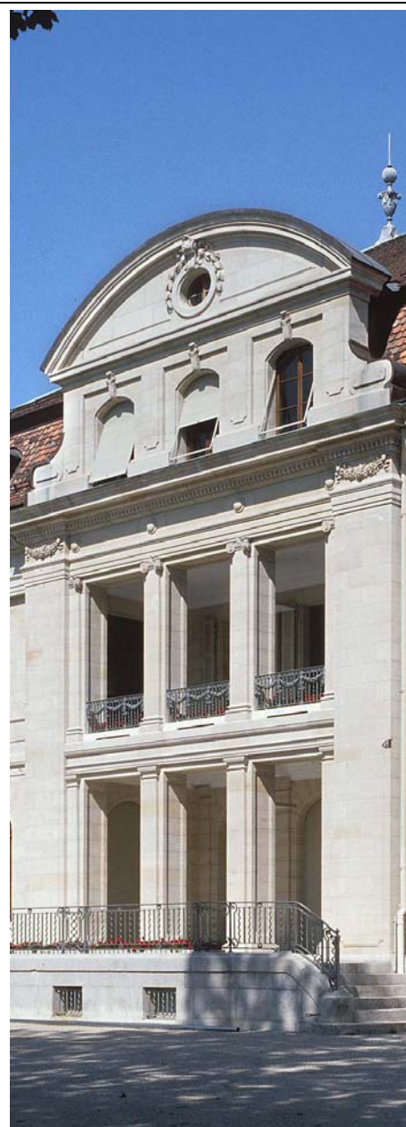
Figure 7 - Un fonds de réserve a été constitué pour l'entretien de la Maison des Parlements

L'Union interparlementaire verse à l'Association des Secrétaires généraux de parlements une subvention annuelle dont le montant, calculé chaque année, doit suffire à pourvoir aux dépenses de cette organisation qui ne sont pas couvertes par d'autres sources. Il est souhaitable que les relations entre les deux organisations soient régies par un accord à long terme.