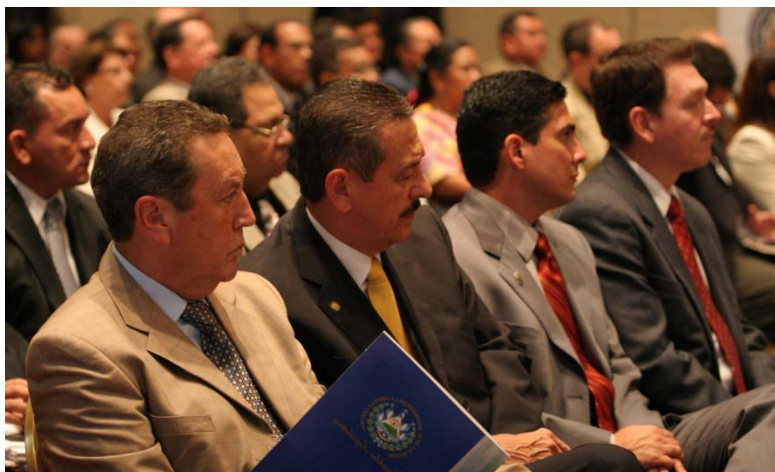
Figure 2 - Délégués au Séminaire sur la réconciliation en El Salvador

Tous les projets de renforcement de l'institution parlementaire accordent une place importante à la sensibilisation à la question transversale de l'équité entre les sexes et à la nécessité d'assurer la participation des femmes à la prise de décision. Les parlements sont instamment priés de veiller à ce que des femmes participent pleinement aux activités du projet et à ce que les délégations aux séminaires soient équilibrées et comptent des femmes et des hommes. Le séminaire sur la réconciliation portera une attention particulière aux effets du conflit sur les femmes et promouvra le rôle des femmes dans les processus de consolidation de la paix et de réconciliation. La réunion sur le Programme d'action de Bruxelles (PAB) s'intéressera en particulier aux effets de la pauvreté sur les femmes afin que les mécanismes parlementaires du PAB puissent s'attaquer aux causes profondes. Le séminaire sur le secteur de la sécurité sensibilisera les participants aux préoccupations particulières des femmes en matière de sécurité, expliquera comment le processus parlementaire peut répondre à ces préoccupations et quels moyens employer pour associer davantage de femmes au débat sur la sécurité.