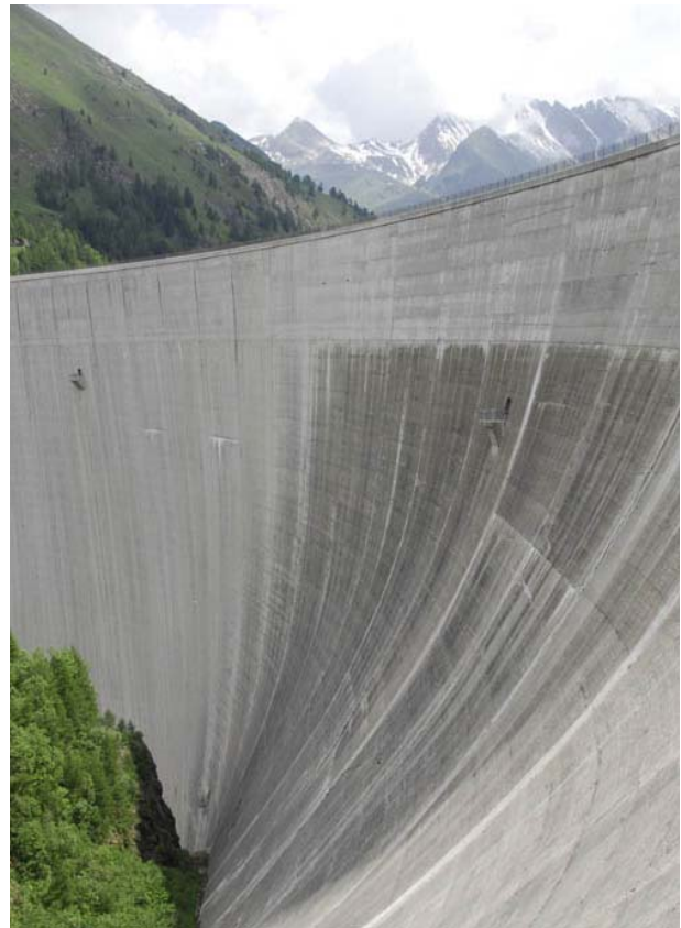
Figure 5 - Barrage de Luzzone. L'UIP consomme de l'électricité provenant exclusivement de sources renouvelables.

La Division est toujours à l'affût des économies possibles pour réduire les frais d'administration. Il y aura en 2010 une nouvelle réduction des coûts lorsque le mobilier de bureau acheté pour le Siège sera intégralement amorti. Cependant, en raison de la forte proportion des coûts fixes dans ce centre de coûts tels que l'amortissement et les assurances, les plus grandes économies viendront à l'avenir d'économies d'échelle, qui seront réalisées à mesure que se développera l'UIP.