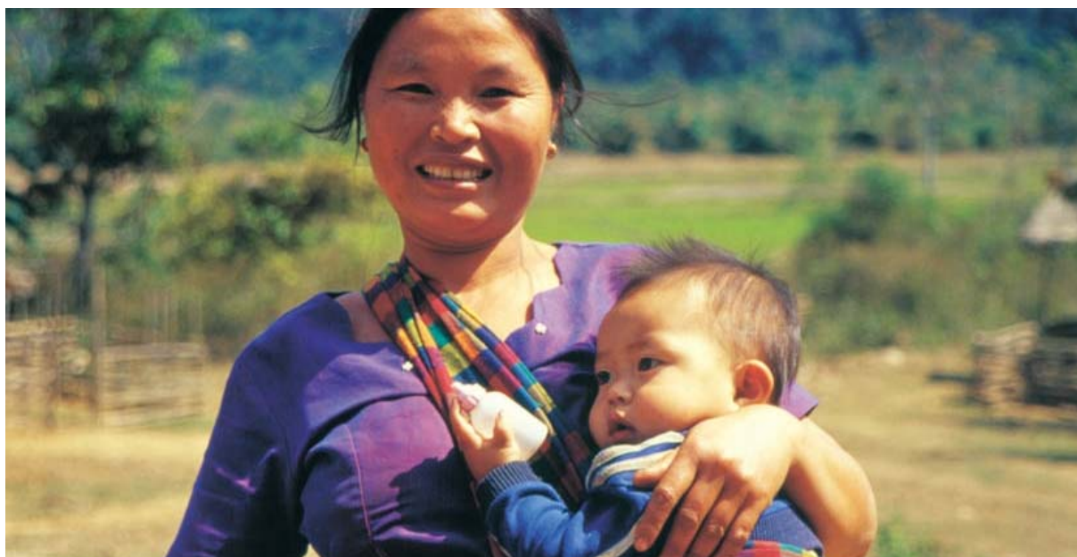
Figure 3 - L'UIP a lancé un programme de promotion de la santé maternelle et infantile

Les activités auront un impact sur l'environnement. Dans le but de réduire les effets délétères, le Secrétariat s'efforcera de publier l'information sous forme électronique et d'exploiter les possibilités de contacts virtuels pour diminuer le nombre de voyages nécessaires.