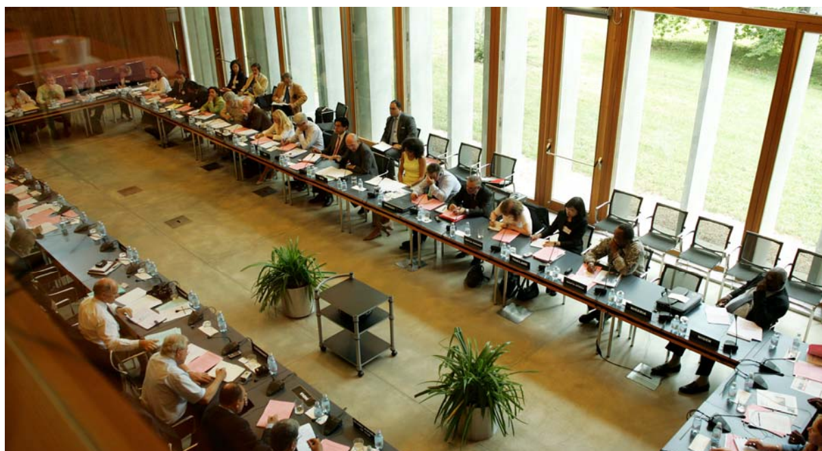
Figure 6 - L'UIP entend porter le taux d'occupation de ses installations de réunion à 50 pour cent du temps au moins.

Depuis 2008, la Division fait la chasse aux émissions indirectes de gaz à effet de serre produites par les voyages internationaux du personnel et en rend compte tous les ans au Conseil directeur.