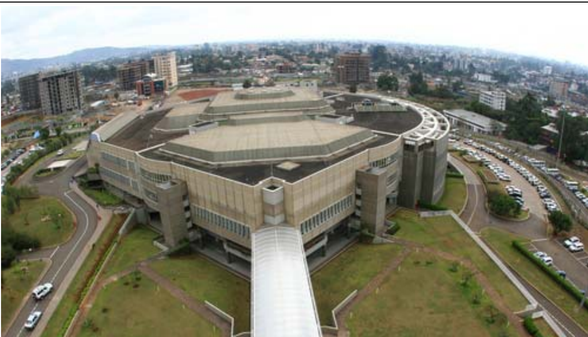
Figure 1 – Centre de conférence des Nations Unies à Addis Abeba

Au sein de l'Assemblée, trois organes – la Réunion des femmes parlementaires, le Comité de coordination des femmes parlementaires et le Groupe du partenariat entre hommes et femmes – veillent à ce que les femmes déléguées participent aux débats de l'Assemblée et à ce que les questions de parité et les points de vue des femmes tiennent une place importante dans ces discussions.