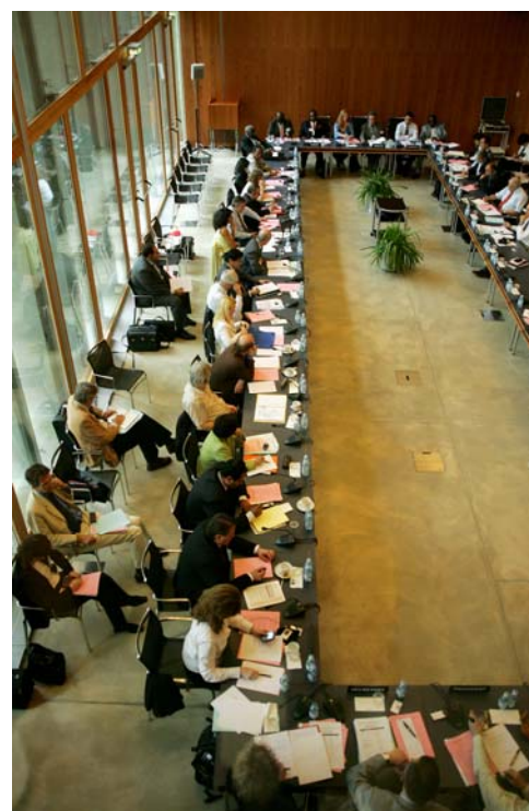
Figure 4 - Un Comité de pilotage se réunit deux fois par an pour préparer la Conférence parlementaire annuelle sur l'OMC.

Pour ce qui est de l'information et de la vulgarisation, l'UIP appliquera les recommandations énoncées dans le rapport Saatchi & Saatchi de 2005 sur sa stratégie d'information et de communication. Le service d'information sera réorganisé et renforcé pour faire plus largement connaître l'UIP et surtout mieux mettre à profit les outils modernes de communication.